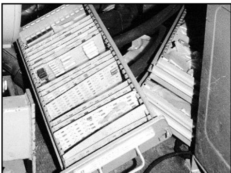
Herausgerissene Ersatzteilkästen in einer zum Verschrotten abgestellten Steuerkabine Stromversorgung für den PRW-13, 1991.

Mit kameradschaftlichen Grüßen Ernst Liese aus 63110 Rodgau