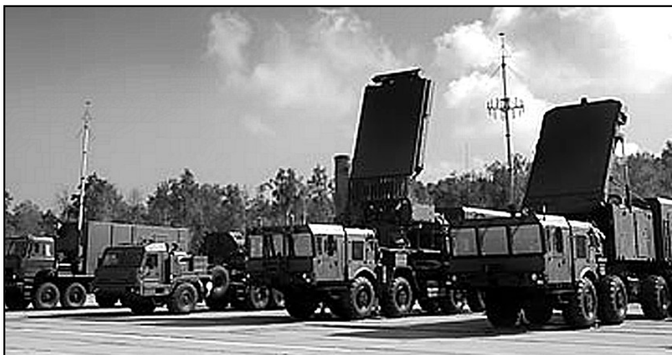
Bestandteile des S-400: Links der Gefechtsstand 55K6E, entspricht einem Regiments-GS, rechts daneben eine Starteinrichtung 5P85SE2 oder TE2 mit 4 Raketen in Containern, rechts daneben eine MRLS 92N6E, entspricht der RLS einer FRA im herkömmlichen Sinne, und rechts außen der Funkmesskomplex 91N6E zur Funkmesssicherstellung des Gefechtsstandes.

Burghard Keuthe Hauptstraße 24, 19372 Wulfsahl Redaktionsschluß: 01.09.2008 Preis: 0,25 EURO Für Mitglieder kostenlos. Vervielfältigung, auch auszugsweise, ist nicht gestattet.