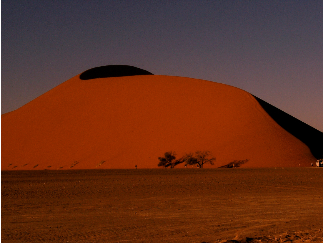
21 Namib-Wüste: Eine der höchsten Dünen, 400m