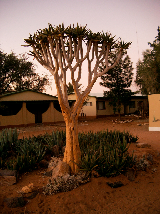
10 Koeberbaum auf der Lodge