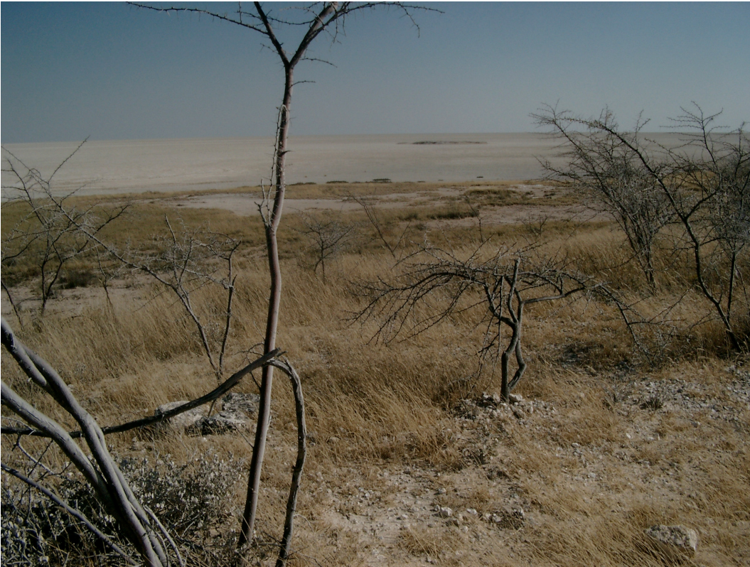
11 Blick auf die Etosha-Pan