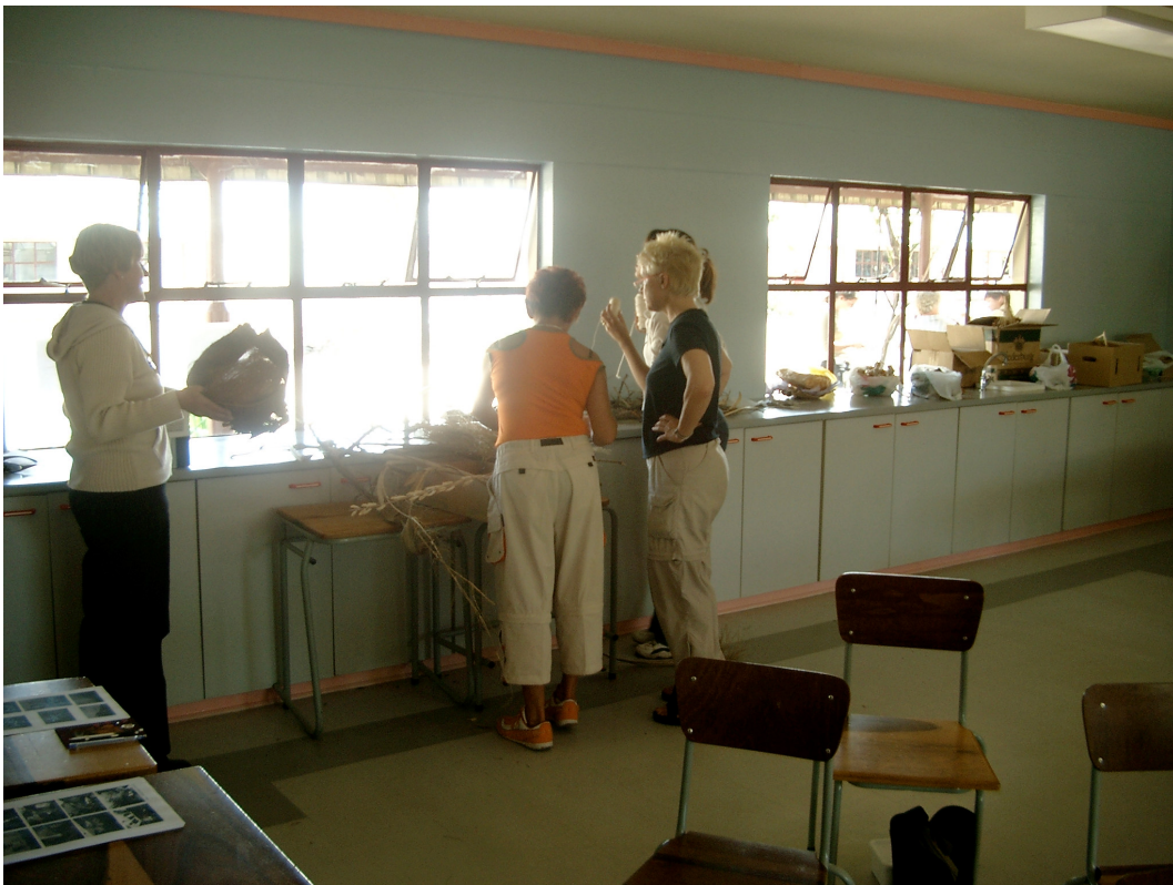
6 Manuelas Kunstworkshop: Arbeiten mit Naturmaterialien aus Namibia