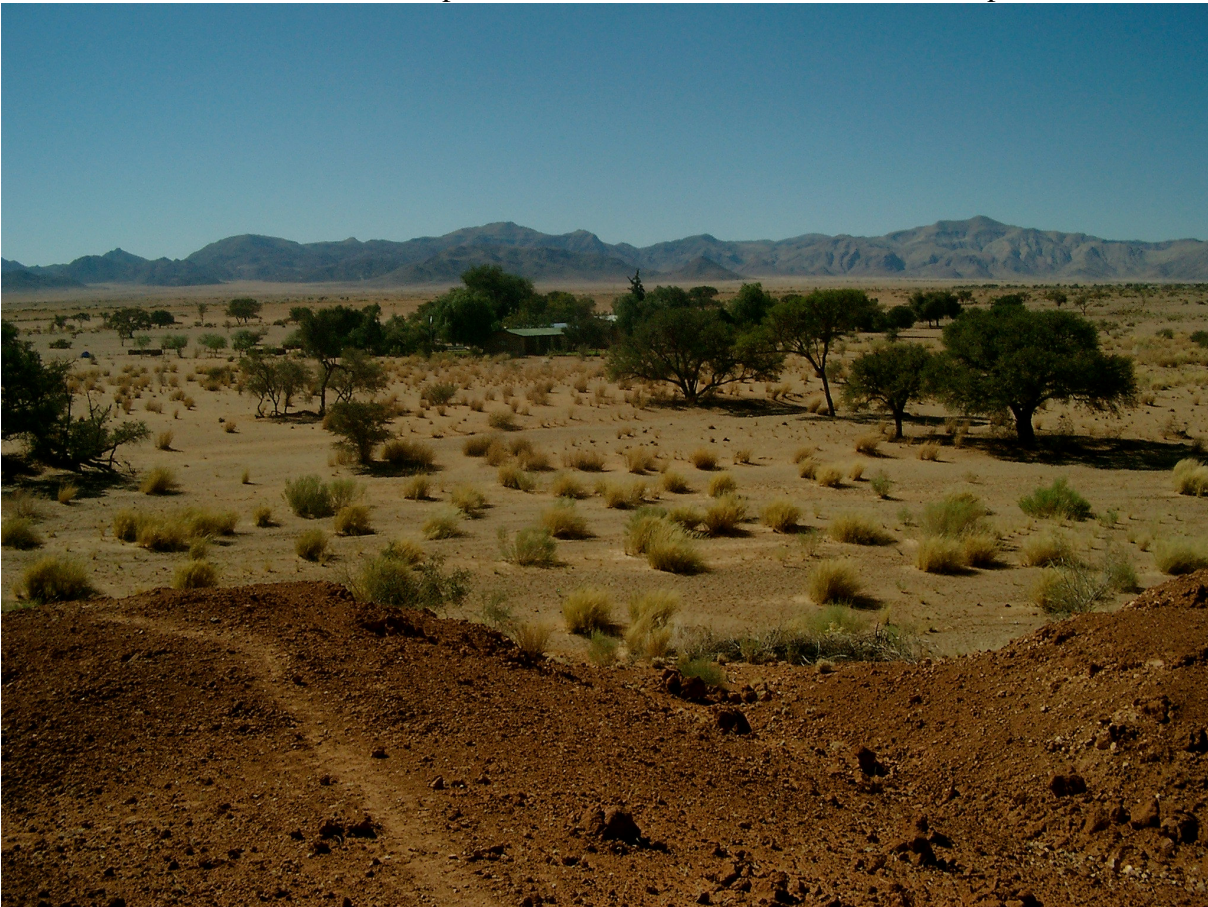
8 Petrified Dune Lodge am Rand der Namib-Wüste