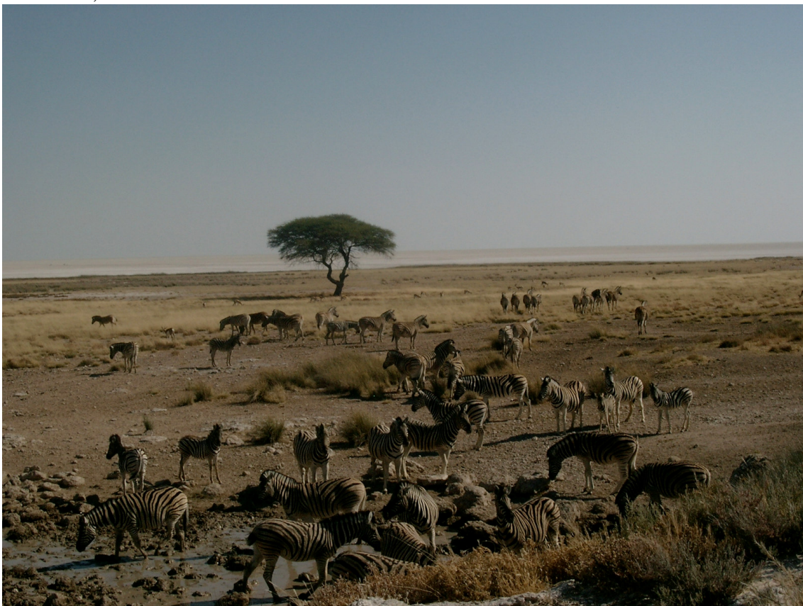
18 Etosha, Fächerakazie