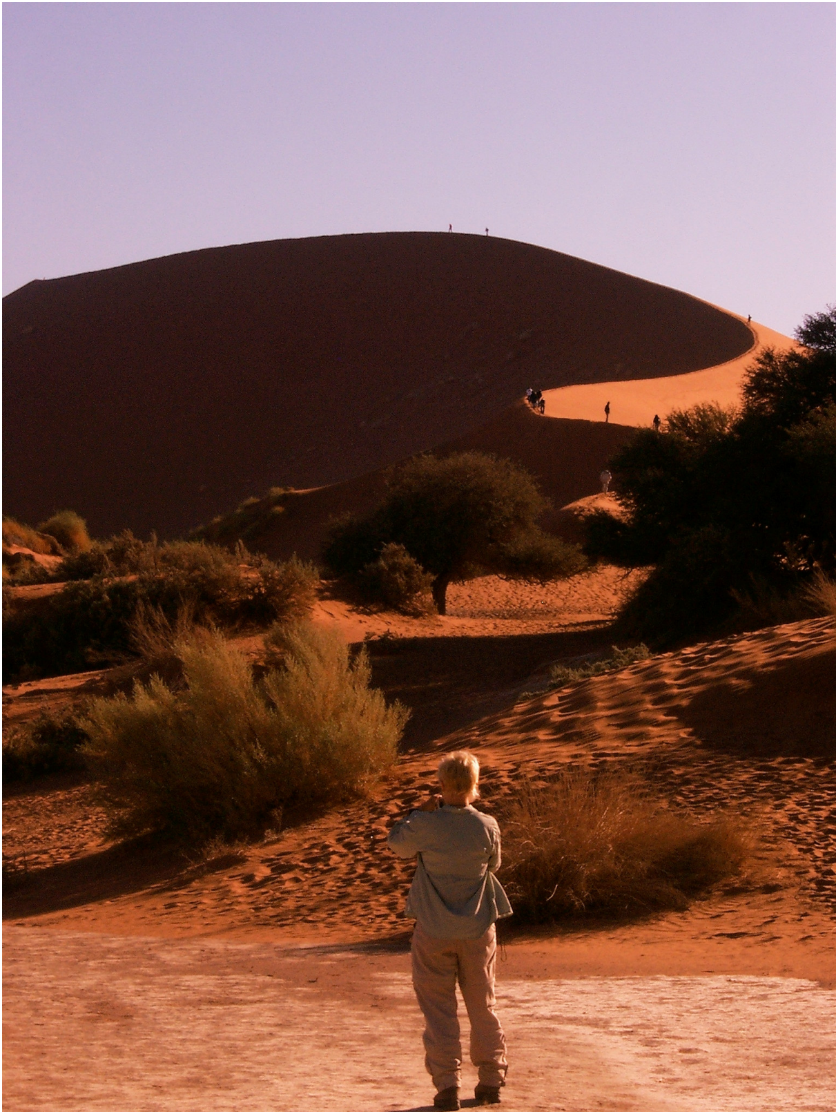
23 Namib-Wüste, Dünenbesteigung