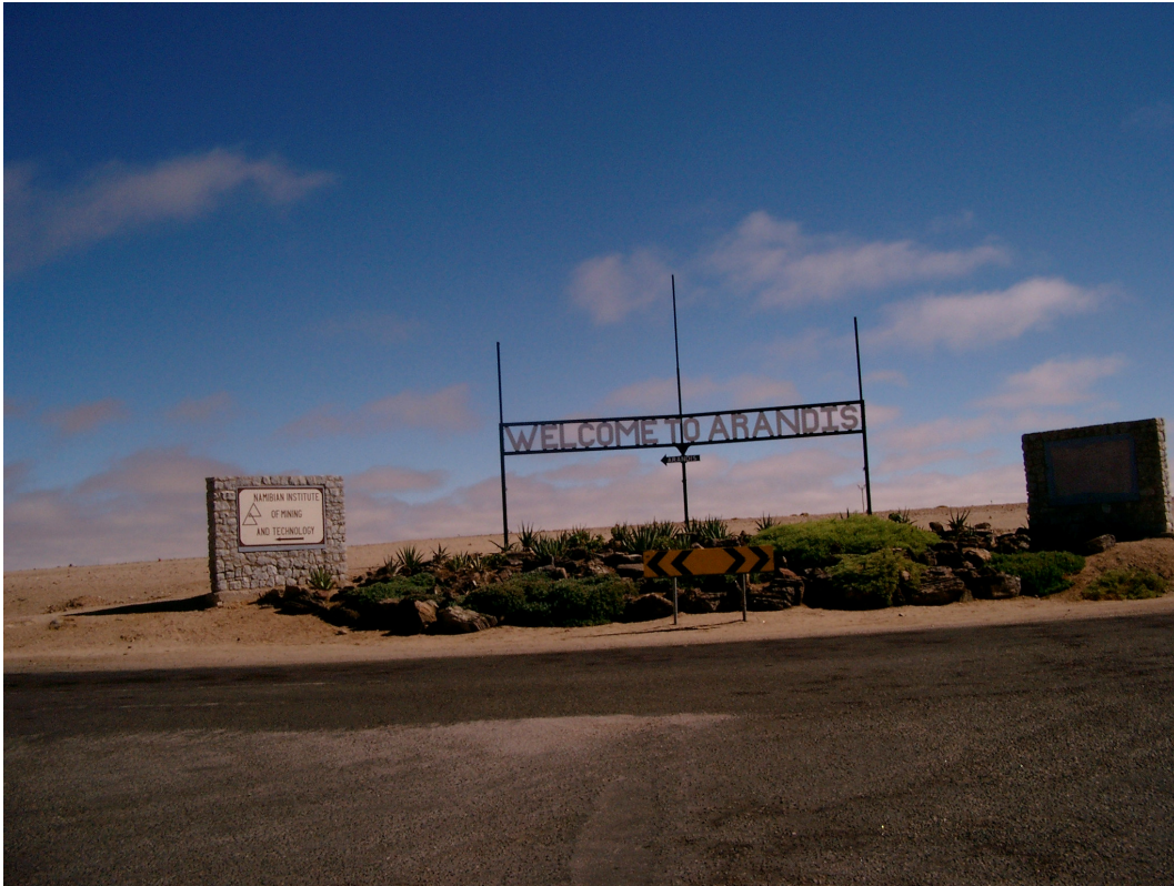
1 Fortbildung in der Minenschule in Arandis, mitten in der Wüste