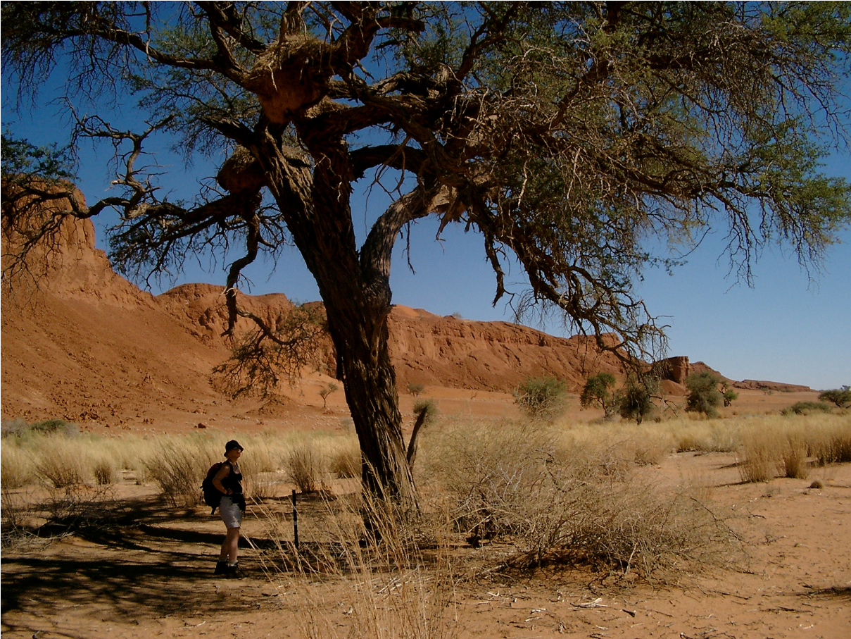
9 Versteinerte Düne an einem Flussbett neben der Petrified Dune Lodge