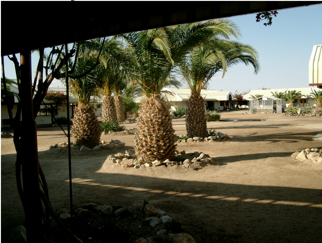
2 Fortbildung für deutschsprachige Erzieher und Lehrer aus Namibia