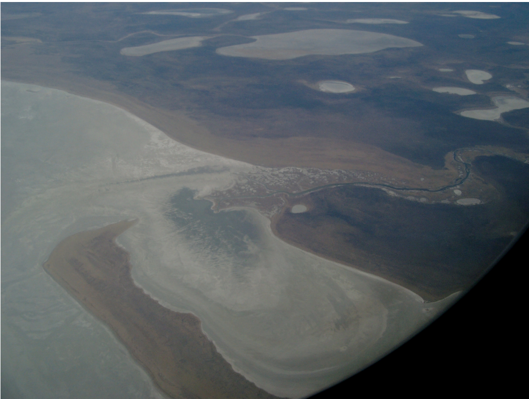
12 Blick auf die Etosha-Pan aus dem Flugzeug