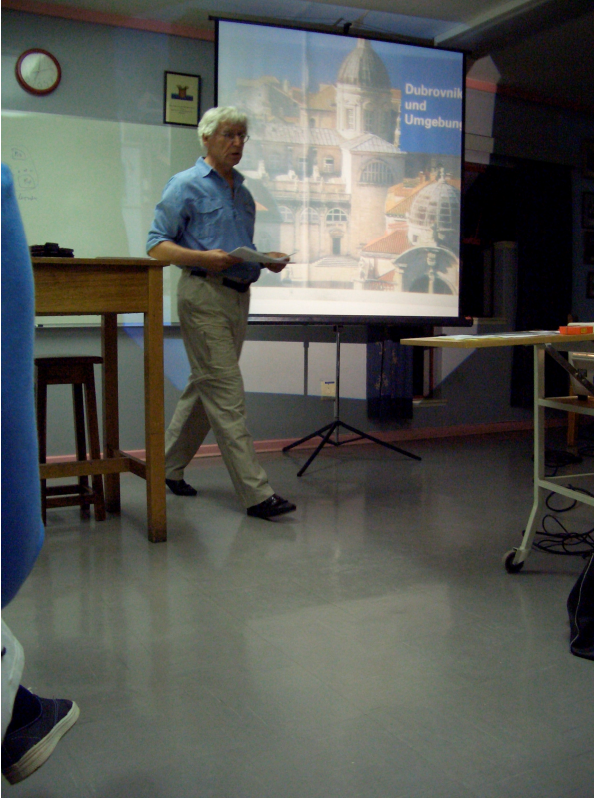
3 Mein Vortrag über selbstorganisiertes Lernen