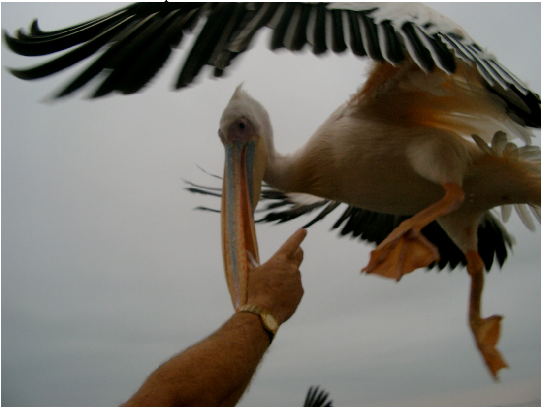
24 Auf einem Schiff, Fisch für einen Pelikan