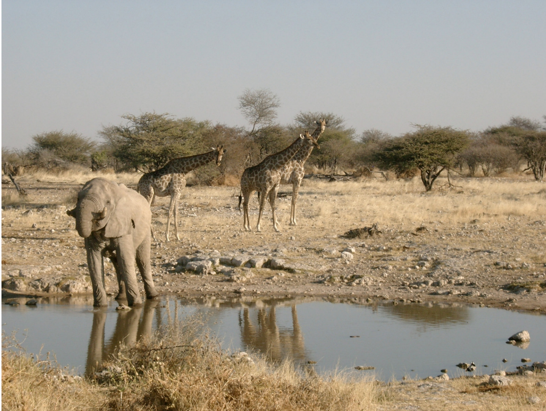
17 Etosha, wartende Giraffen