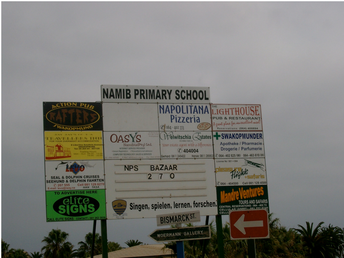
24 Grundschule in Swakopmund