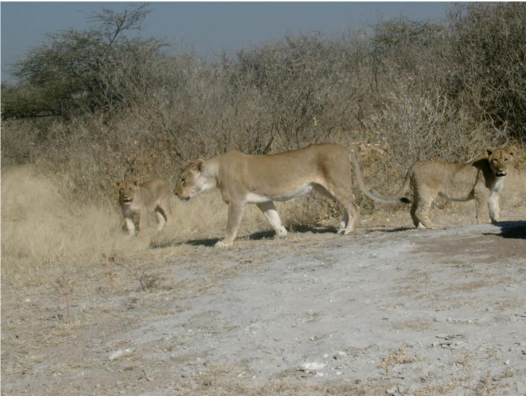
14 In der Etosha-Pan