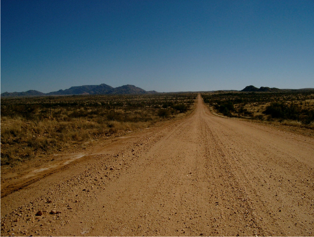
19 Eine typische Schotterstraße