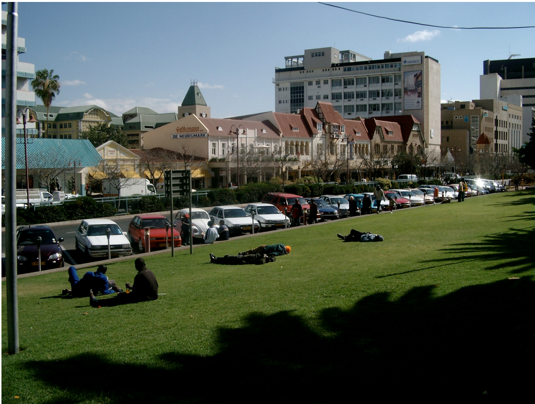
27 Windhoek, Independence Street