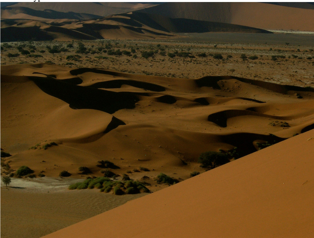
20 In der Namib-Wüste