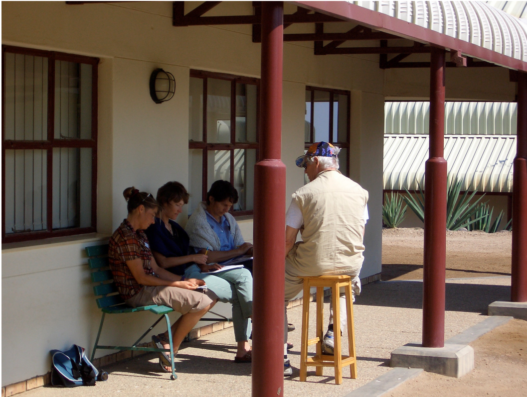
5 Workshop: "Mathematik entdecken"