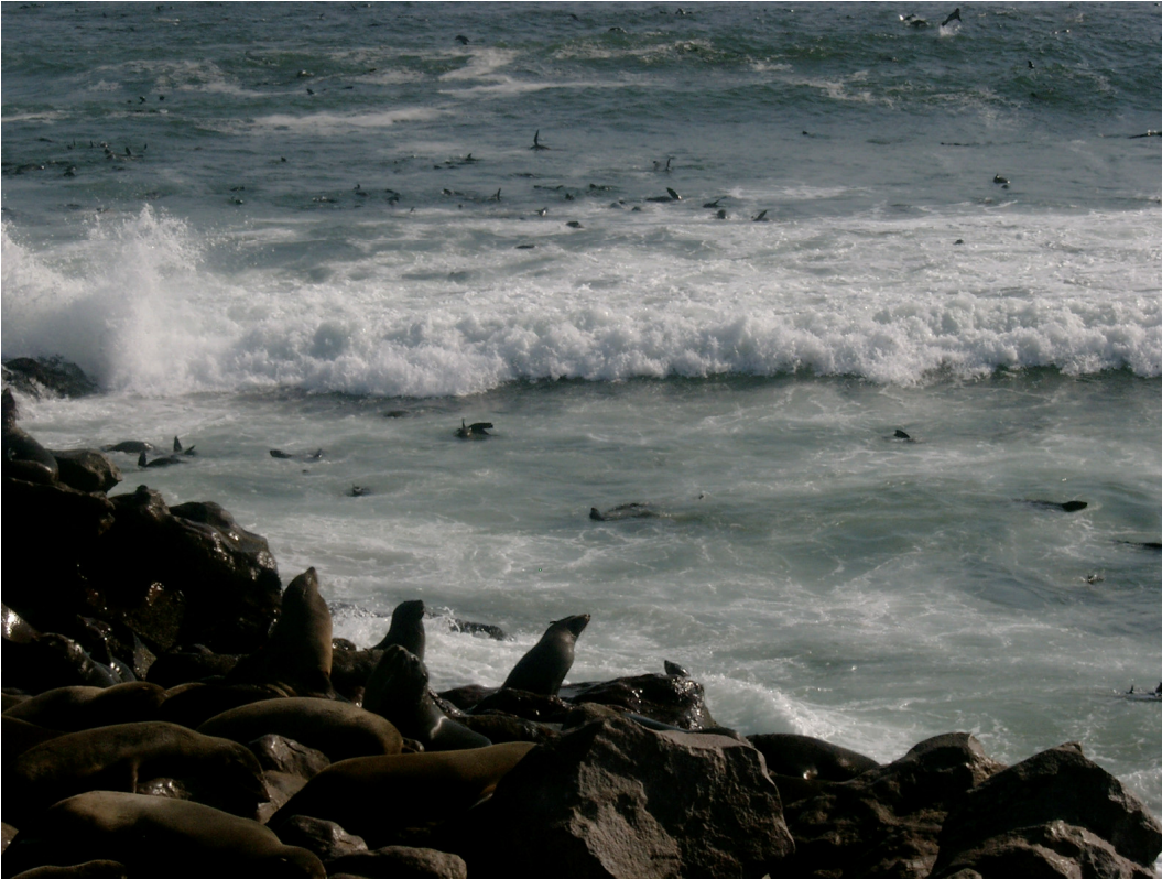
7 Tausende von Seehunden bei Cape Cross am Atlantik, nördlich von Swakopmund