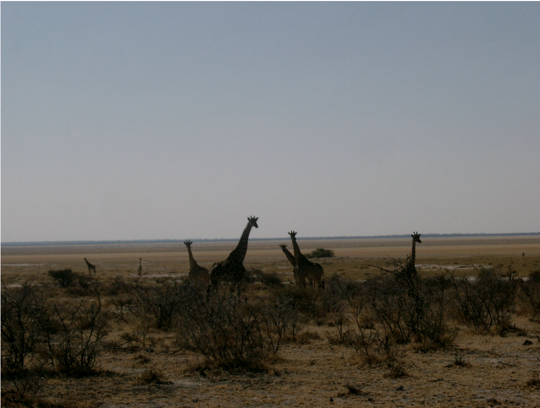
13 Blick in die Etosha-Pan vom Auto aus